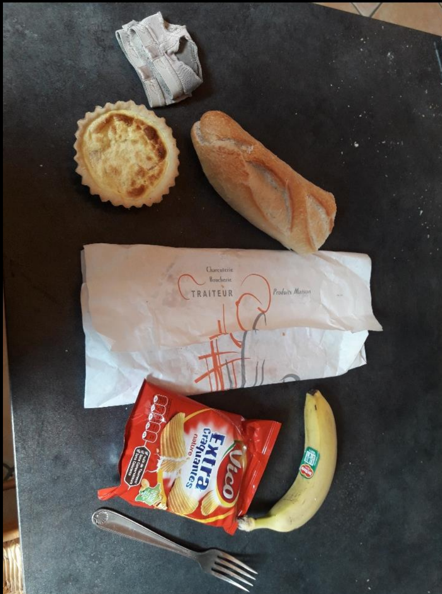
Quiche faites maison , jambon acheter chez un charcutier ,chips acheter , banane acheter en magasin