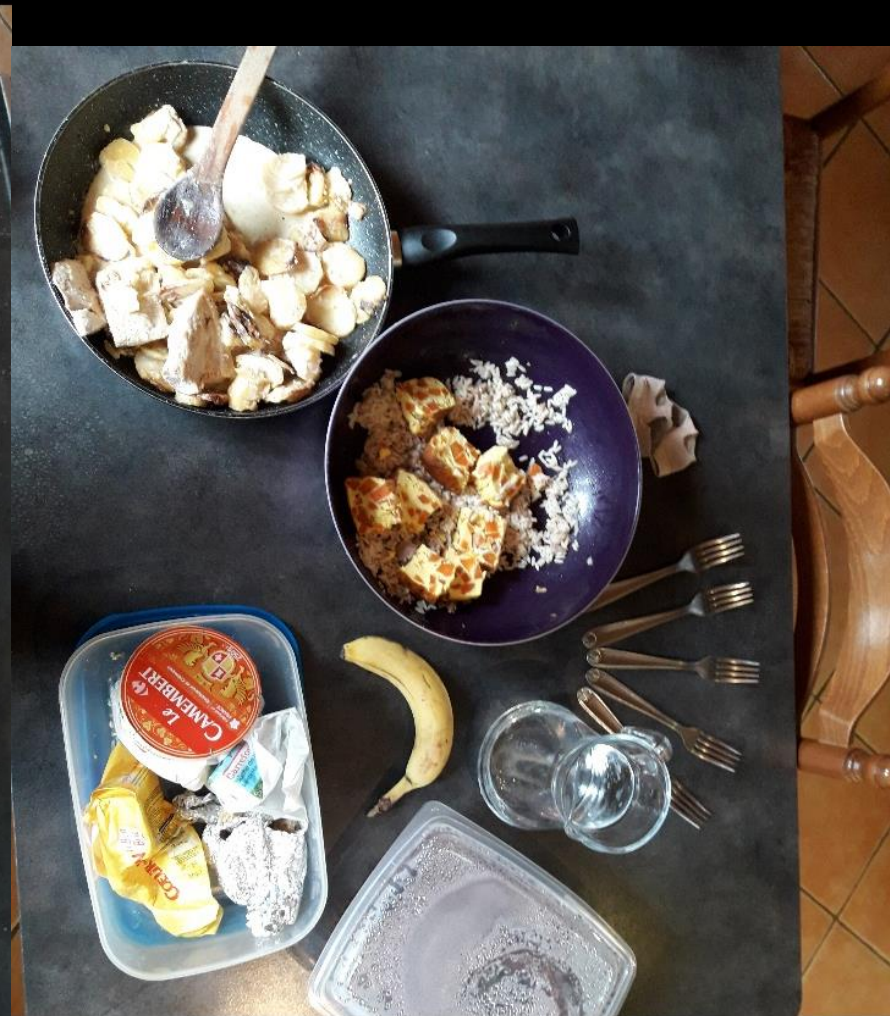
Riz acheter en magasin ,boudin fait par l'association de chasse , terrine de carotte avec carotte acheter t terrine faites maison, gratin pommé de terre bio du jardin de mon papy et ma mamie ,fromage acheter en magasin ,fruit acheter en magasin