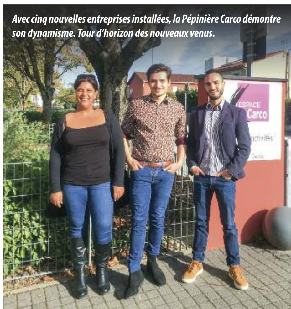
Avec cinq nouvelles entreprises installées, la Pépinière Carco démontre son dynamisme. Tour d’horizon des nouveaux venus.