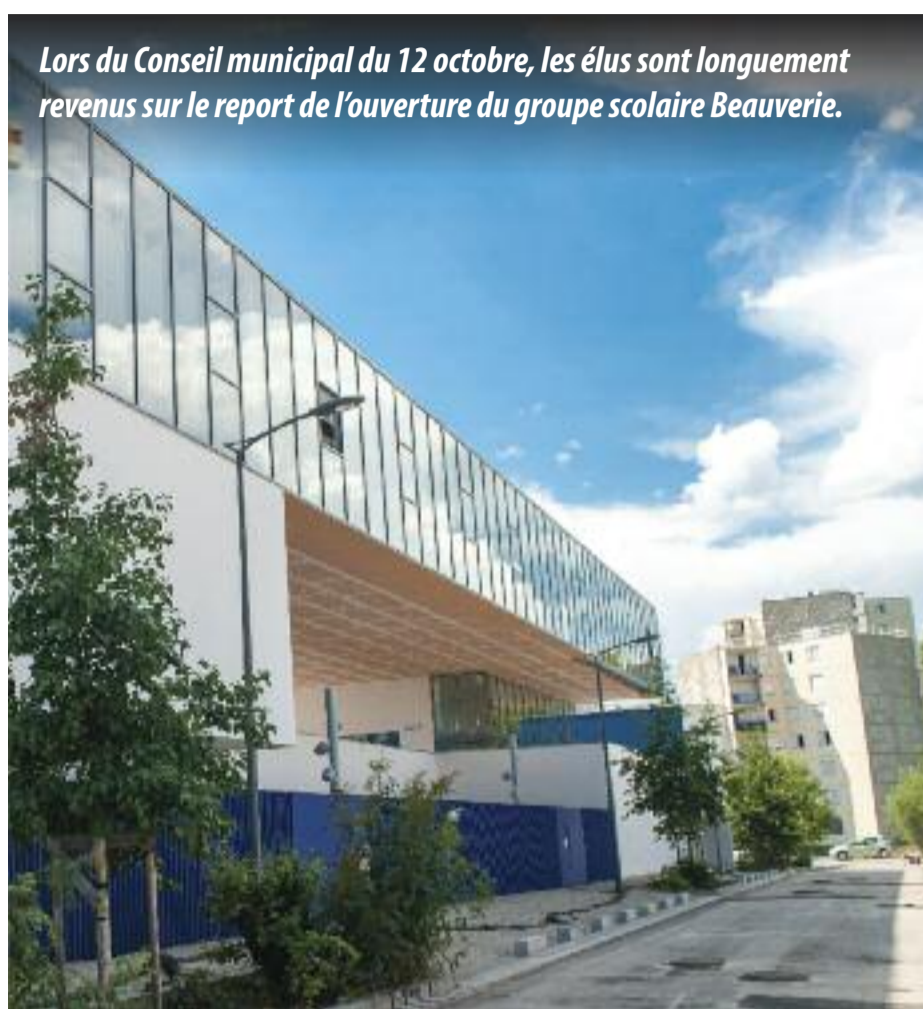
Lors du Conseil municipal du 12 octobre, les élus sont longuement revenus sur le report de l'ouverture du groupe scolaire Beauverie.