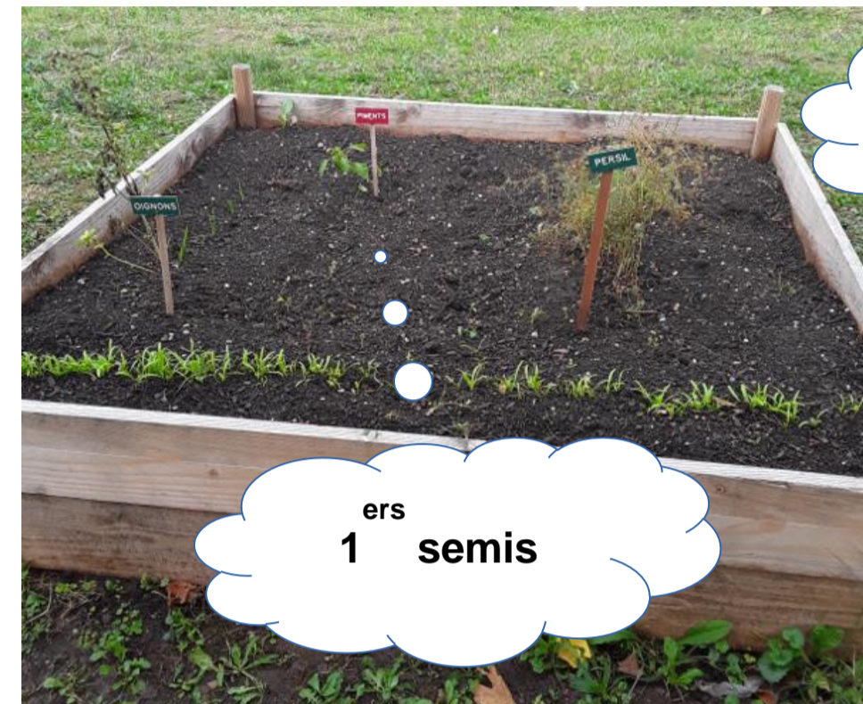
1 ers semis