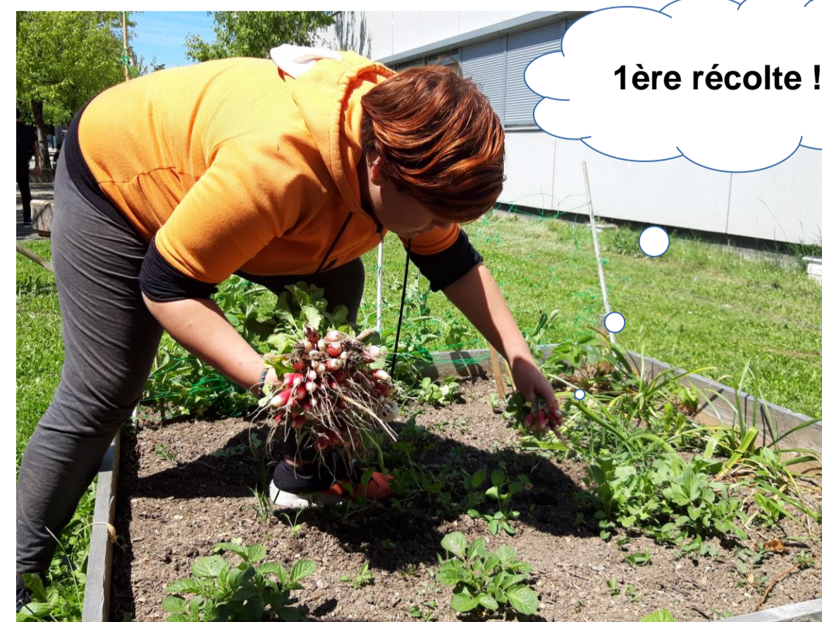
1ère récolte !