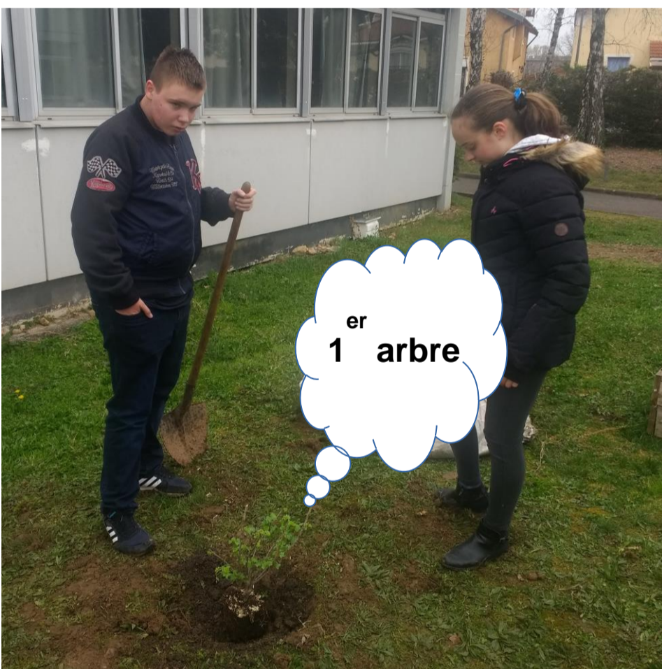
1 er arbre