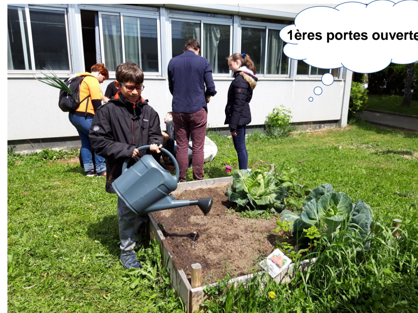
1ères portes ouvertes