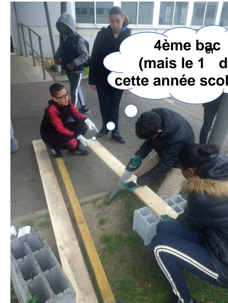
4ème bac (mais le 1 er de cette année scolaire)