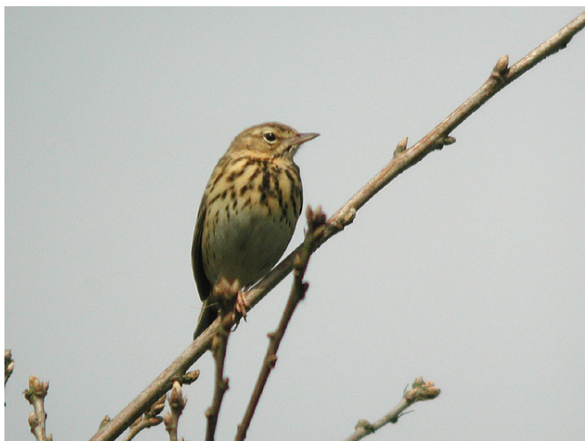
• le pipit des prés