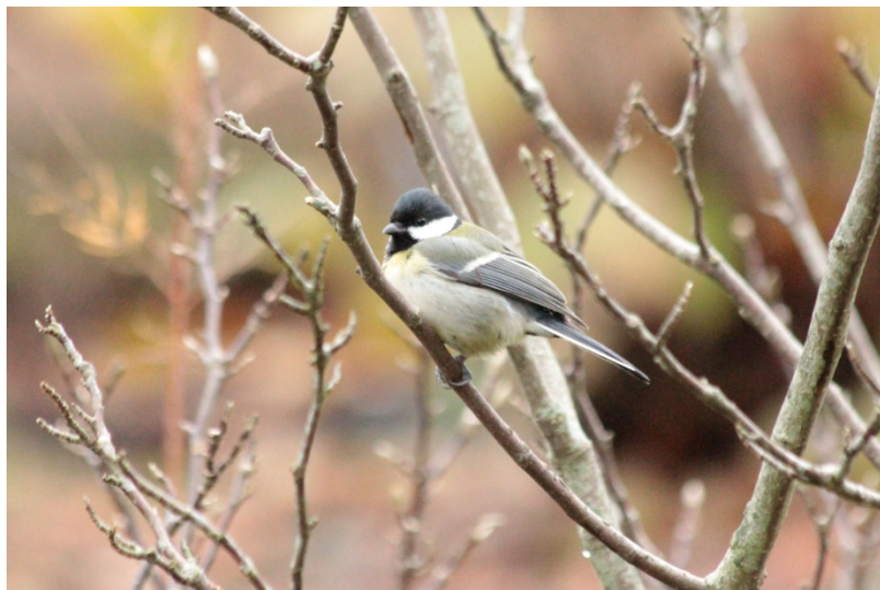
• la mésange charbonnière