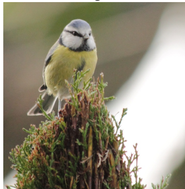
• la mésange bleue